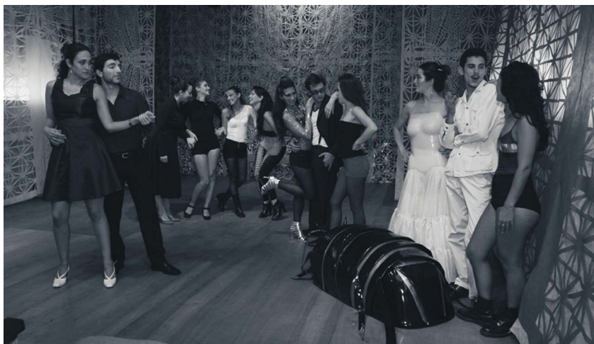
El proyecto de graduación, “Me niego a entender”, se presentará en la Universidad Finis Terrae de Chile.

Mediante distintas propuestas, el arte de la Casa de Altos Estudios responde al principal objetivo del Programa de Promoción de la Universidad Argentina: difundir las actividades de las Universidades Nacionales a nivel internacional.