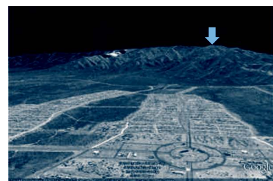
Imagen satelital: posible ubicación de un futuro parque eólico visto desde la ciudad de La Punta.