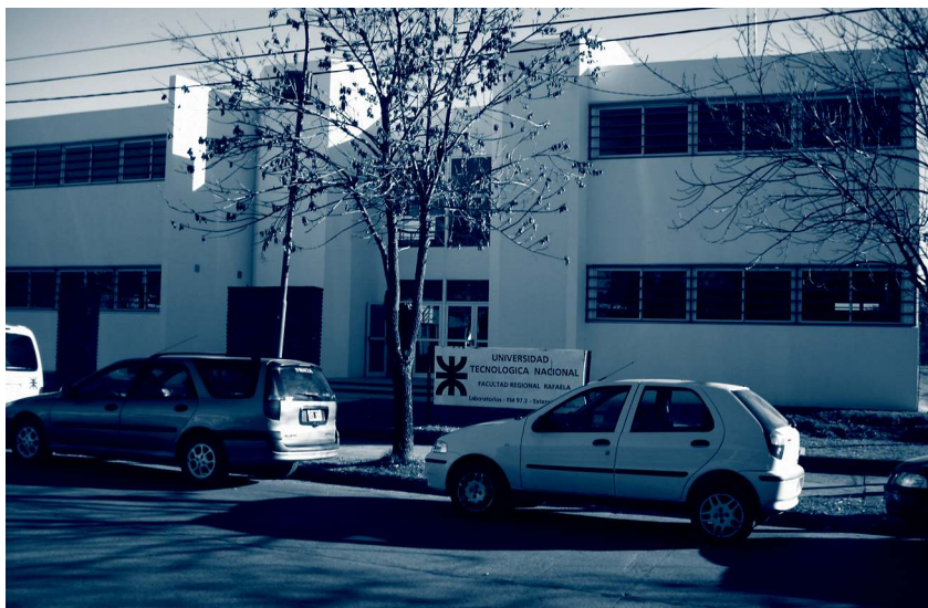
El proyecto de la UTN Rafaela es financiado por el Programa de Promoción de la Universidad Argentina y sumará a otras facultades regionales para extender su alcance.

Mediante la formación de recursos humanos orientados a potenciar y consolidar la capacidad exportadora de las empresas de la región, la Universidad impulsa un programa que se llevará a cabo en el transcurso de este año.