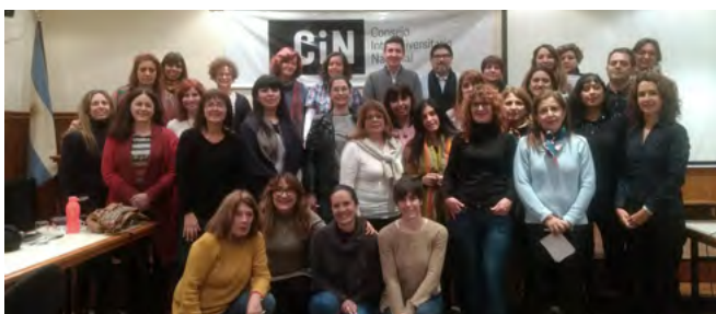
Agosto 2018 - RID