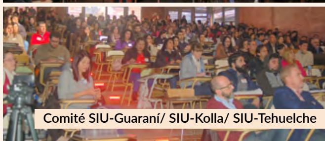
Comité SIU-Guaraní/ SIU-Kolla/ SIU-Tehuelche