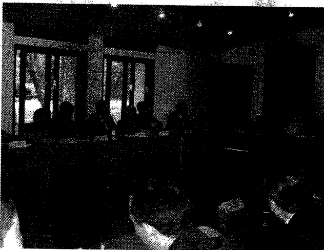
Un momento de la reunión de rectores e instituciones universitarias de Iberoamérica en Méjico. Participó una delegación del CIN

Junto con la OEI y el CUIB, participan en la conformación del Espacio IA del conocimiento, sobre la base de tres componentes: la educación básica, la educación superior y la investigación y el desarrollo y la innovación tecnológica. No es del estilo del Proceso de Bolonia, no se trata de uniformar sino trabajar sobre