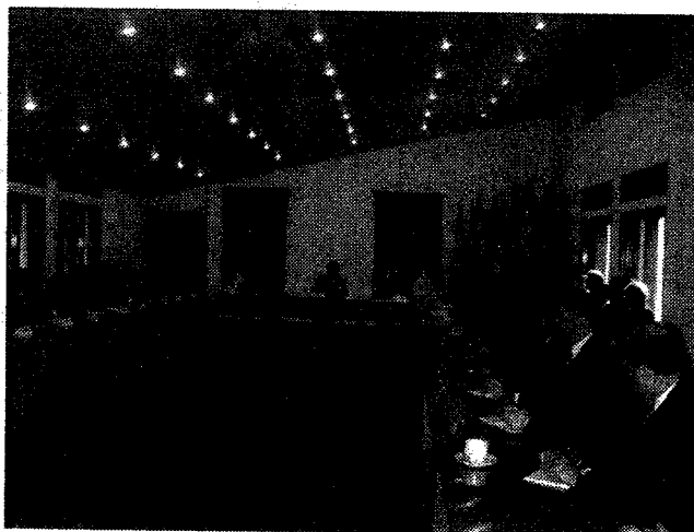
La próxima reunión de este Pleno se realizará en la Argentina, por decisión de esta asamblea